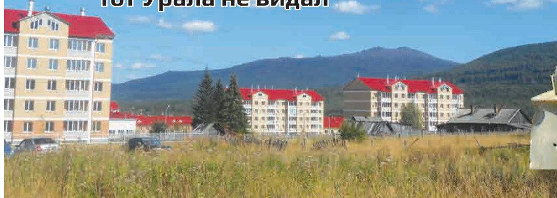
Вид из поселка Кытлым на Косьвинский Камень (слева), Тылайский и Конжаковский Камень

Кто в Кытлыме не бывал – тот Урала не видал