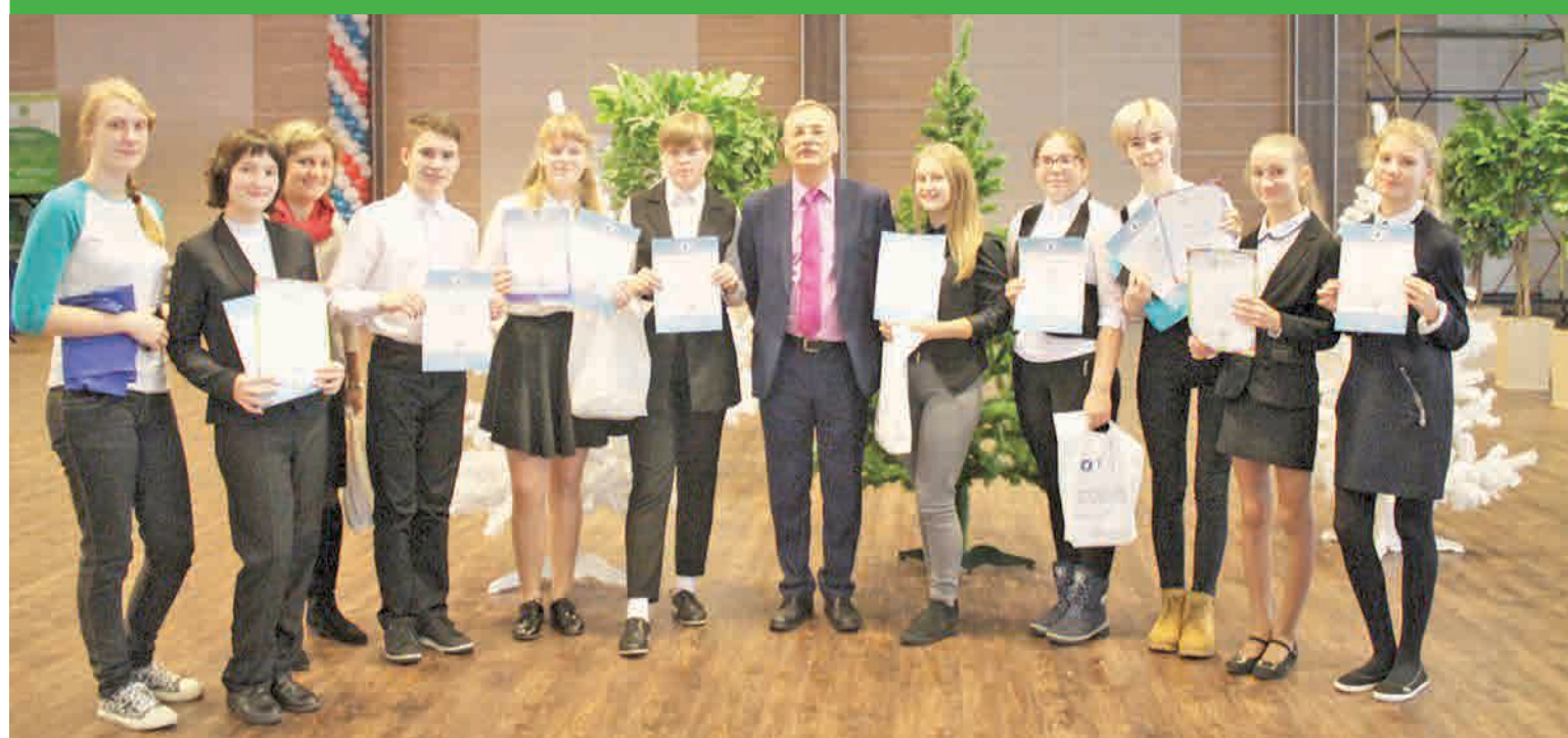
Ученики седьмой школы вернулись с наградами с интеллектуального чемпионата «Познание и творчество»